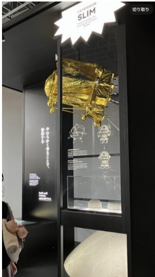
日本政府館に常設展示されたSLIM脚部のラティス構造の衝撃吸収材の展示風景（中央右の半円状）

れた企業・団体の中から、県内の産学官の主要団体で構成される「富県宮城推進会議」幹事への意見聴取等を経て知事が決定したものです。